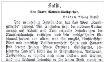
A batikról szóló cikke részlete