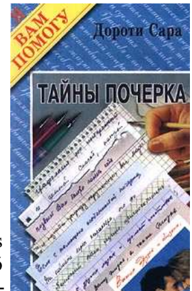
Dorothy Sara orosz nyelvű fordított könyvének címlapja (A kézírás titkai, 1997)

Oroszországban, grafológiai képzésről pedig egyáltalán nem. Az új tudomány iránt mindenekelőtt a pszichológusok kezdtek érdeklődni, megtapasztalván az írásban rejlő pszichodiagnosztikai lehetőségeket. Az első, magukat grafológusként feltüntető szakemberek valójában a rendelkezésükre álló hazai és külföldi szakirodalom alapján, önképzés útján sajátították el a szakma rejtelmait, és kezdték azt a gyakorlatban is alkalmazni. E grafológusok közül mindenekelőtt az Ukrajnában élő Vlagyimir Taranyenko és az szentpétervári Ilja Scsogoljev nevének kell megemlíteni. Taranyenko Pocserk, portret, harakter (Kézírás, portré, jellem) című könyve 2001-ben jelent meg Kijevben, melyet azóta több újabb kiadás követett. A számtalan népszerű tudományos pszichológiai könyv szerzője, Ilja Scsogoljev 2003 óta foglalkozik grafológiával. 2004-ben már két könyve is megjelent Tajni pocserka (A kézírás titkai), illetve